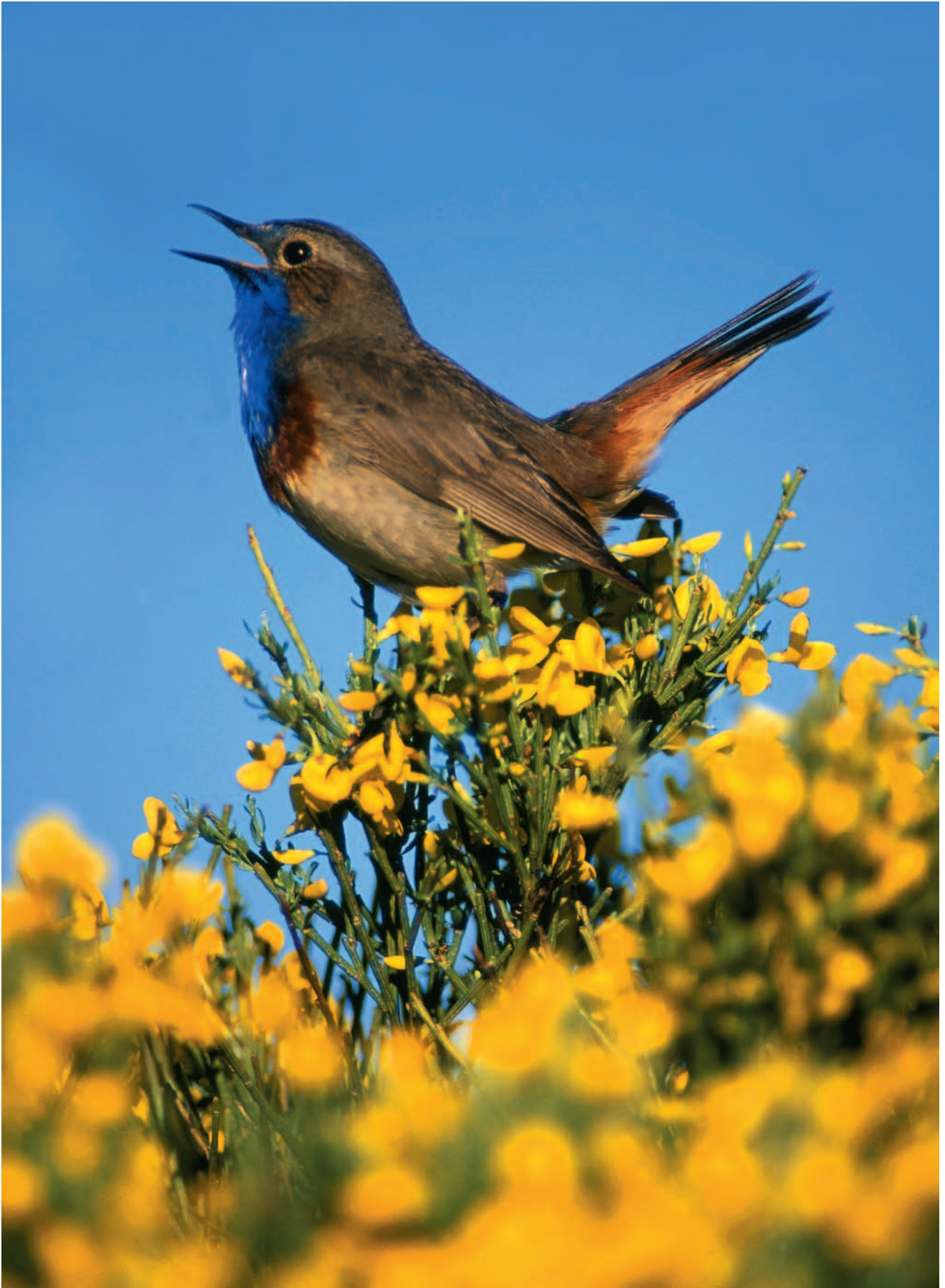
Pechiazul ( Luscinia svecica ).