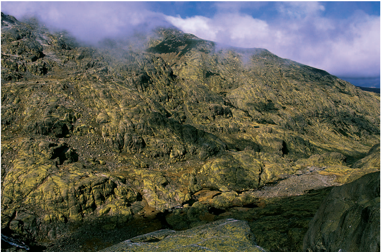
Garganta de Gredos

Especies principales, con sus poblaciones y criterios de importancia.