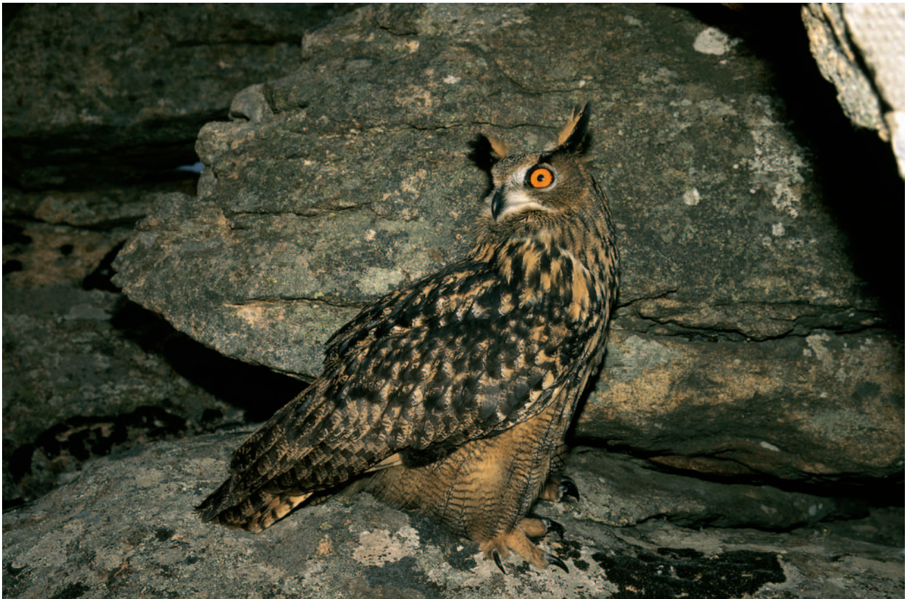
Búho Real ( Bubo bubo ).

Destaca sobre todo la importante y completa comunidad de aves de alta montaña (Bisbita